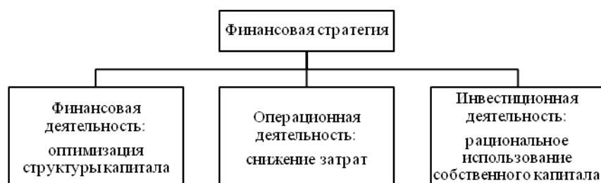
Рис. 3. Карта финансовой стратегии

Для объектов исследования важным направлением финансовой стратегии как фактора нейтрализации угроз экономической безопасности является обеспечение и поддержание финансового устойчивого положения. На рис. 3 представлена авторская карта финансовой стратегии.