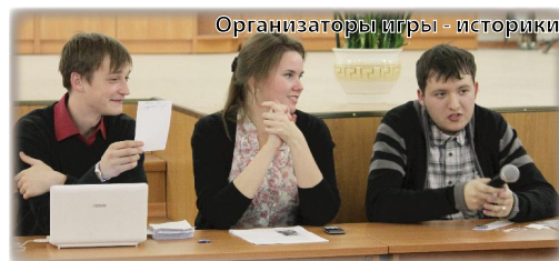
Организаторы игры - историки

Если и вы загорелись желанием сыграть в спортивный вариант «Что? Где? Когда?», обращайтесь на исторический факультет.