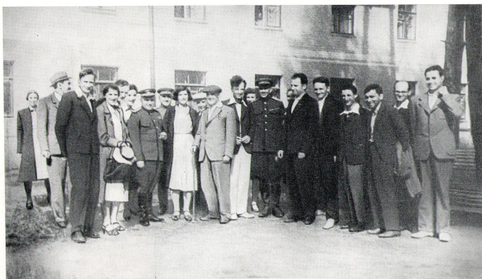
Московские физики в Иванове в день полного солнечного затмения 9 июля 1945 г. В центре — П. Л. Капица и Л. Д. Ландау

Великая Отечественная война. Впереди мирная жизнь. Только что Родина отметила заслуги ученых высокими наградами. Петр Леонидович 30 апреля 1945 года стал Героем Социалистического труда за разработку и осуществление нового метода получения жидкого кислорода. 10 июня 1945 года Н. Н. Семенов получил первый из девяти (!) орден Ленина, а Л. Д. Ландау — орден Трудового Красного Знамени.